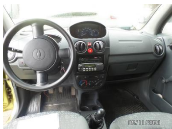
Fot. 30 foto 30