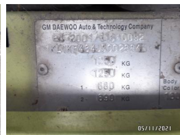
Fot. 32 foto 32