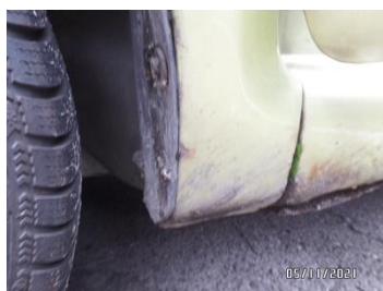
Fot. 22 foto 22