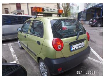
Fot. 5 foto 5