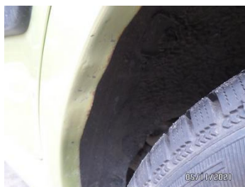
Fot. 19 foto 19