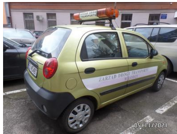
Fot. 3 foto 3