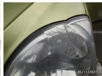
Fot. 12 foto 12