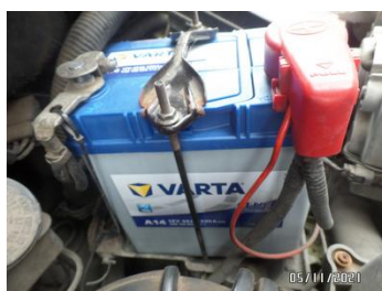
Fot. 35 foto 35