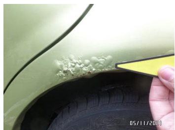
Fot. 17 foto 17