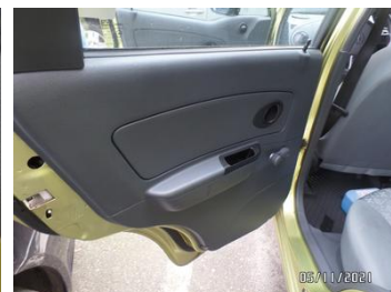
Fot. 28 foto 28