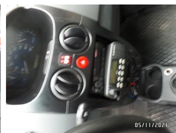
Fot. 24 foto 24