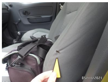
Fot. 27 foto 27