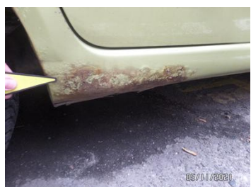
Fot. 13 foto 13