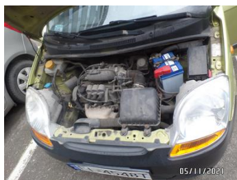
Fot. 31 foto 31