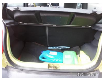
Fot. 39 foto 39