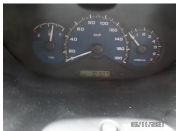
Fot. 26 foto 26