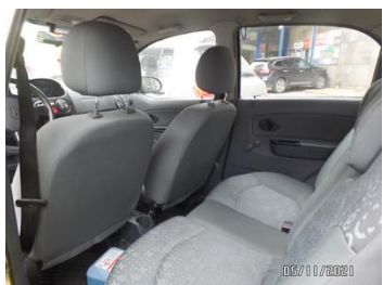
Fot. 29 foto 29