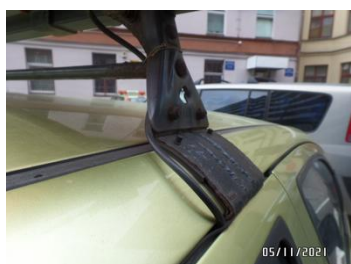
Fot. 38 foto 38