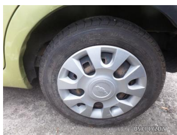
Fot. 7 foto 7