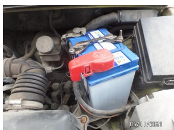
Fot. 34 foto 34