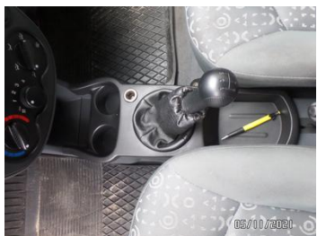
Fot. 25 foto 25