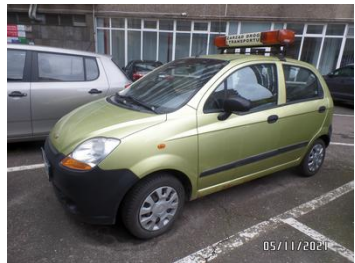
Fot. 1 foto 1