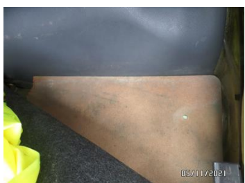
Fot. 41 foto 41