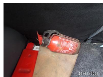
Fot. 40 foto 40