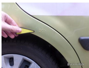
Fot. 15 foto 15