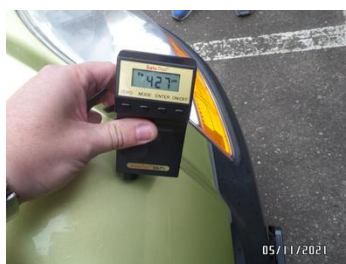
Fot. 43 foto 43