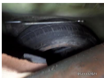
Fot. 42 foto 42