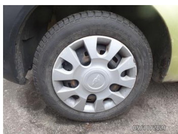
Fot. 6 foto 6