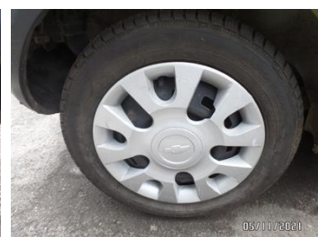
Fot. 8 foto 8