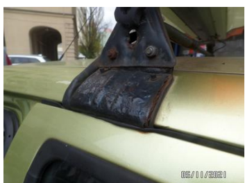
Fot. 37 foto 37