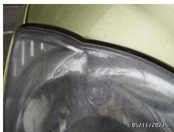
Fot. 11 foto 11