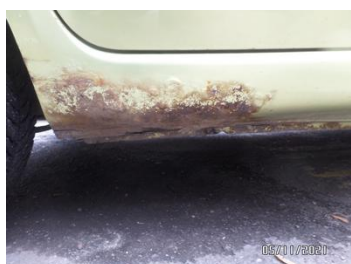
Fot. 14 foto 14