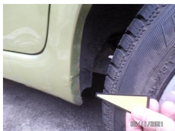
Fot. 18 foto 18