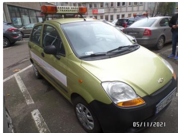
Fot. 2 foto 2