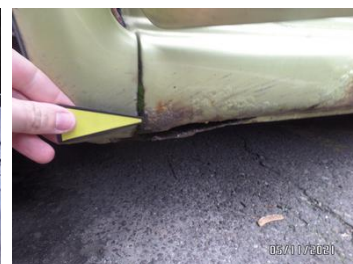
Fot. 20 foto 20