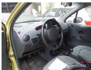
Fot. 23 foto 23