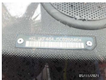
Fot. 10 foto 10