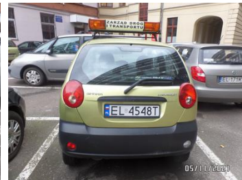
Fot. 4 foto 4