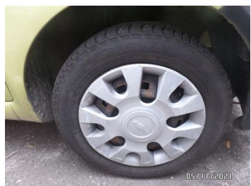
Fot. 9 foto 9