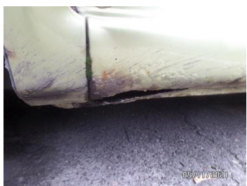
Fot. 21 foto 21