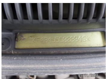
Fot. 33 foto 33