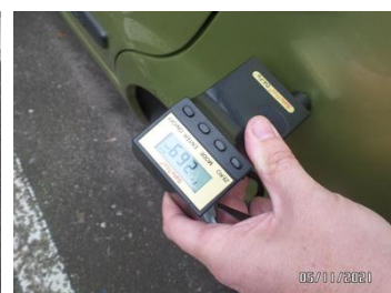
Fot. 44 foto 44