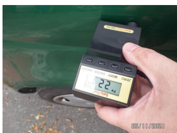
Fot. 41 foto 41