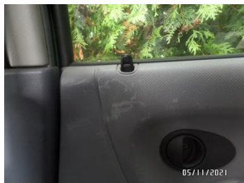
Fot. 30 foto 30