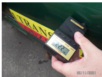
Fot. 39 foto 39