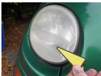
Fot. 14 foto 14