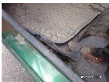
Fot. 21 foto 21