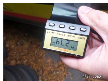
Fot. 44 foto 44