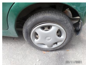
Fot. 8 foto 8