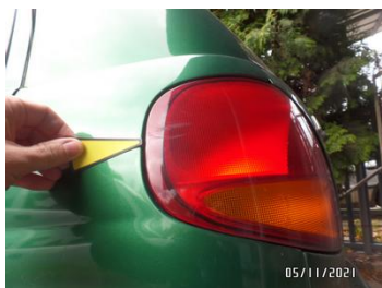
Fot. 18 foto 18