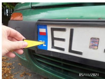
Fot. 15 foto 15