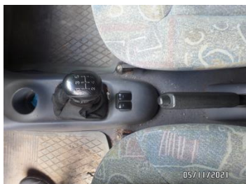
Fot. 25 foto 25