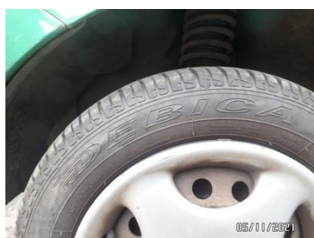
Fot. 7 foto 7