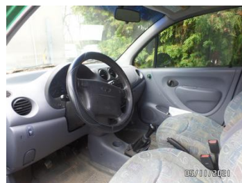
Fot. 20 foto 20