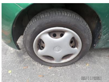
Fot. 6 foto 6