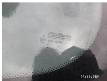
Fot. 11 foto 11