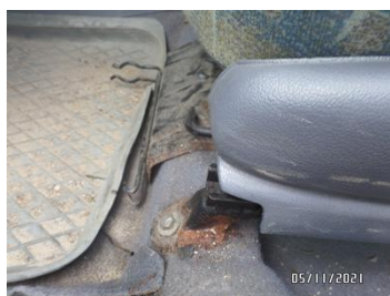
Fot. 22 foto 22