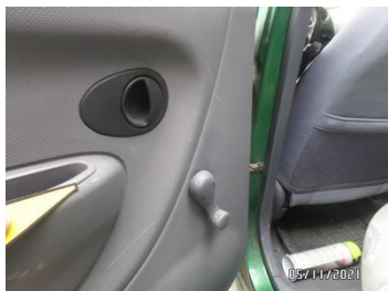
Fot. 29 foto 29