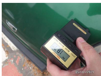
Fot. 42 foto 42