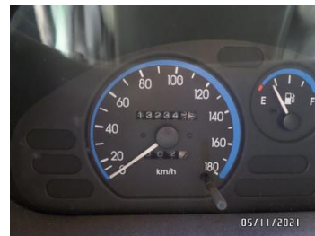
Fot. 32 foto 32