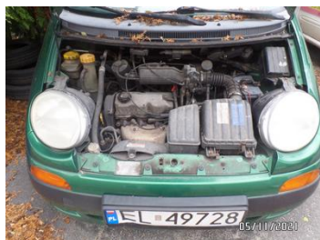
Fot. 34 foto 34