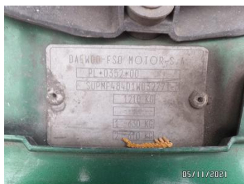
Fot. 38 foto 38