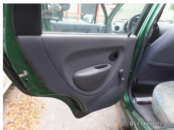
Fot. 26 foto 26