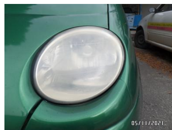
Fot. 12 foto 12