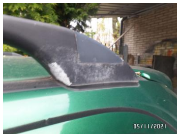
Fot. 31 foto 31