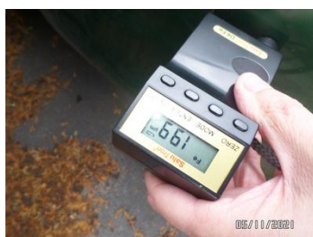
Fot. 43 foto 43