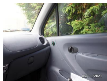
Fot. 24 foto 24