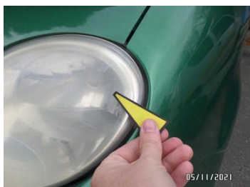
Fot. 13 foto 13