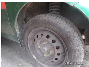
Fot. 10 foto 10