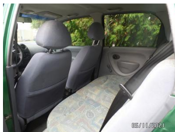
Fot. 27 foto 27