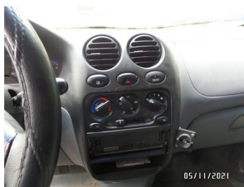
Fot. 23 foto 23