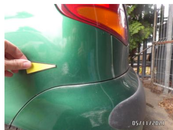
Fot. 16 foto 16