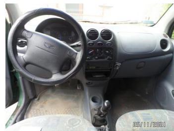
Fot. 28 foto 28