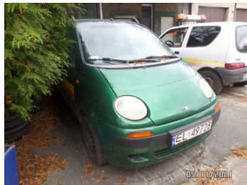
Fot. 3 foto 3