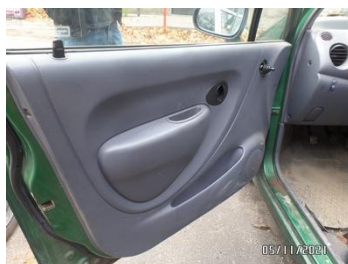
Fot. 19 foto 19