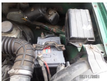
Fot. 37 foto 37