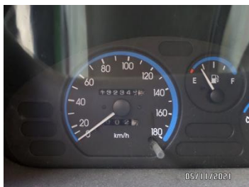
Fot. 33 foto 33