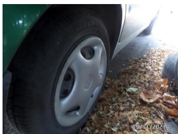
Fot. 9 foto 9