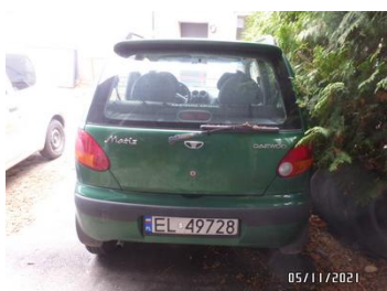
Fot. 5 foto 5