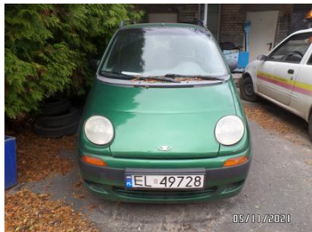
Fot. 2 foto 2