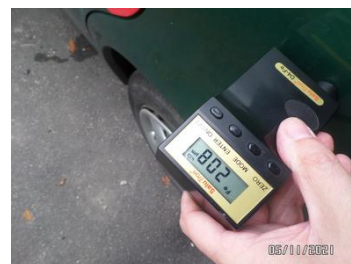
Fot. 40 foto 40