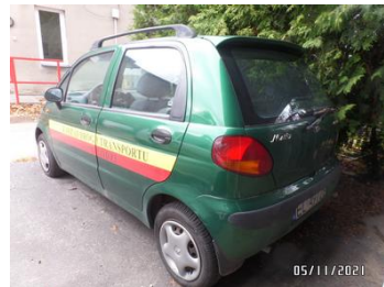
Fot. 4 foto 4