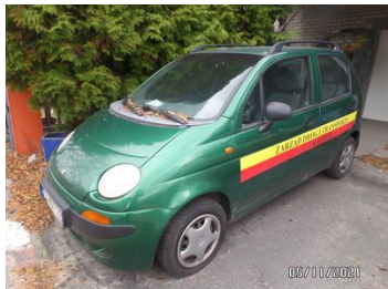
Fot. 1 foto 1