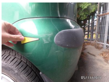
Fot. 17 foto 17