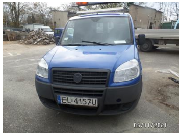
Fot. 2 foto 2