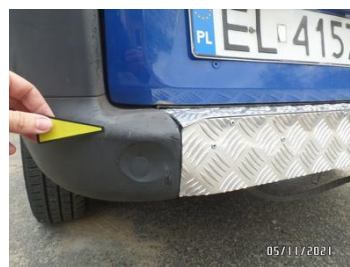
Fot. 24 foto 24