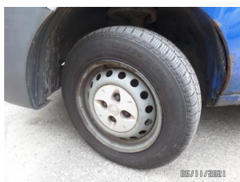
Fot. 7 foto 7