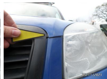
Fot. 16 foto 16