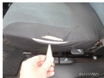
Fot. 32 foto 32