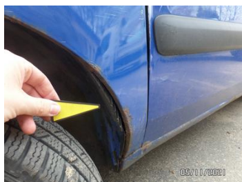
Fot. 18 foto 18