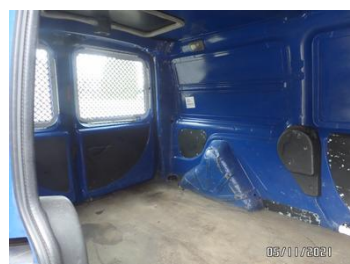
Fot. 40 foto 40