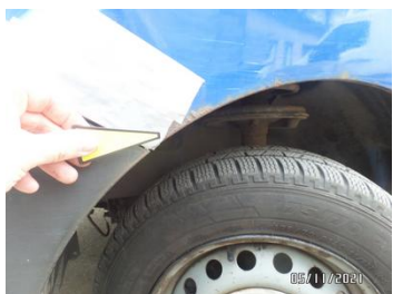
Fot. 17 foto 17