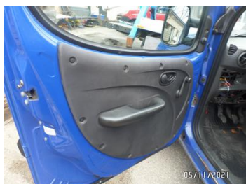
Fot. 30 foto 30