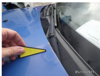
Fot. 19 foto 19