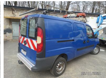
Fot. 4 foto 4