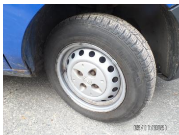
Fot. 10 foto 10