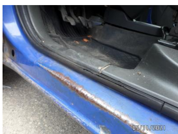
Fot. 37 foto 37