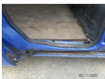
Fot. 43 foto 43