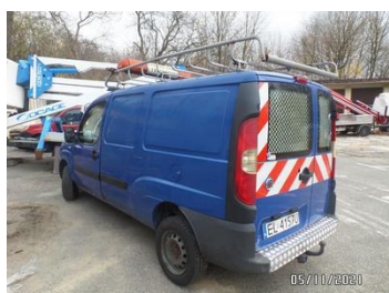
Fot. 6 foto 6