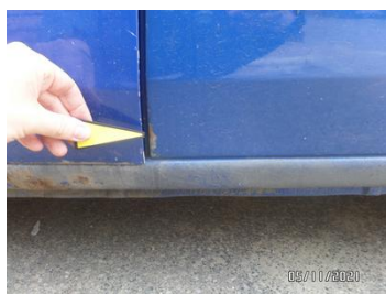
Fot. 22 foto 22