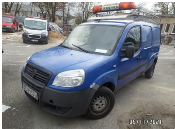
Fot. 1 foto 1

Rodzaj pojazdu: Samochód ciarowy do 3.5t