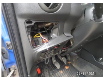
Fot. 33 foto 33