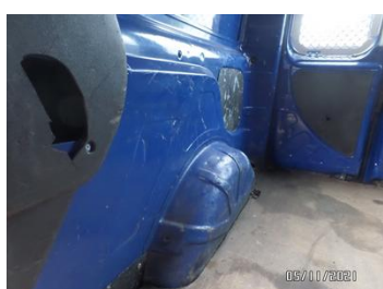
Fot. 42 foto 42