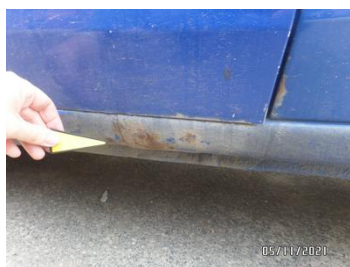
Fot. 23 foto 23