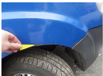
Fot. 13 foto 13