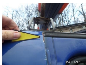
Fot. 44 foto 44