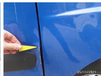
Fot. 12 foto 12