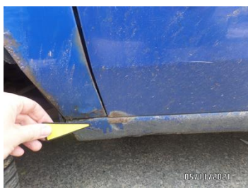
Fot. 21 foto 21