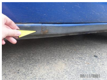
Fot. 27 foto 27