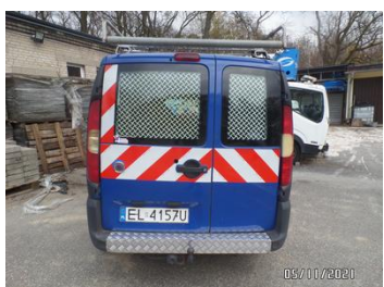
Fot. 5 foto 5