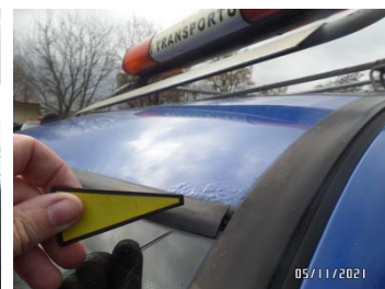
Fot. 20 foto 20