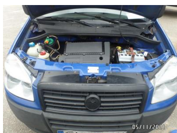
Fot. 38 foto 38