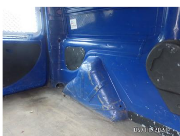
Fot. 41 foto 41