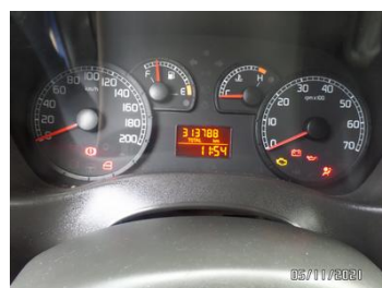
Fot. 36 foto 36