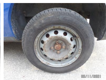
Fot. 8 foto 8