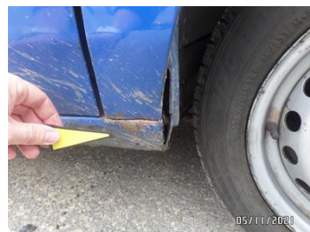
Fot. 28 foto 28