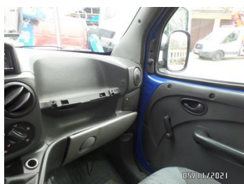
Fot. 35 foto 35