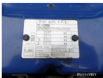
Fot. 39 foto 39