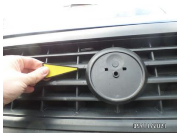
Fot. 15 foto 15