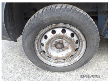
Fot. 9 foto 9