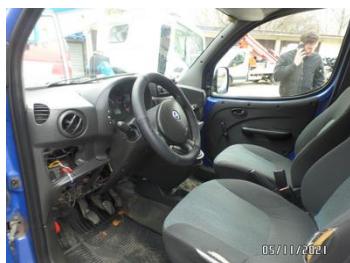
Fot. 31 foto 31