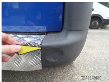
Fot. 25 foto 25