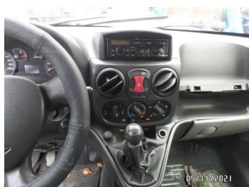
Fot. 34 foto 34