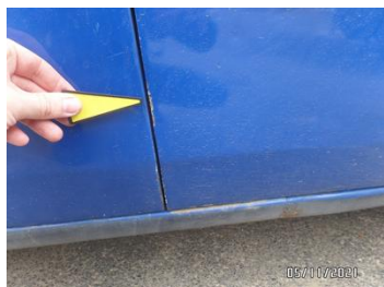
Fot. 26 foto 26