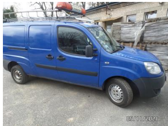
Fot. 3 foto 3