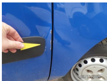
Fot. 11 foto 11