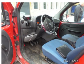
Fot. 35 foto 35