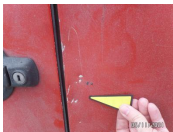
Fot. 19 foto 19