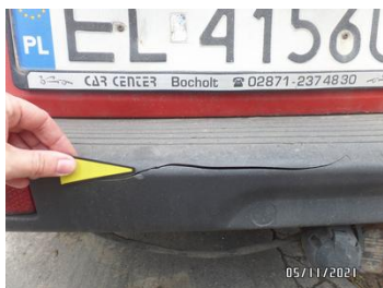
Fot. 18 foto 18