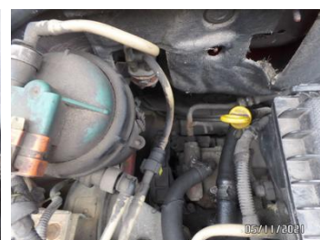
Fot. 60 foto 60