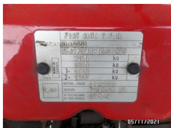
Fot. 54 foto 54