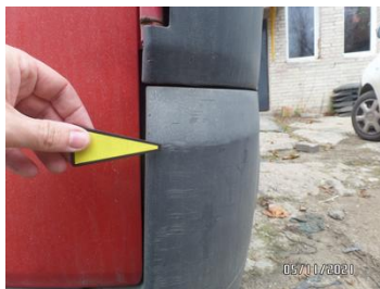
Fot. 22 foto 22