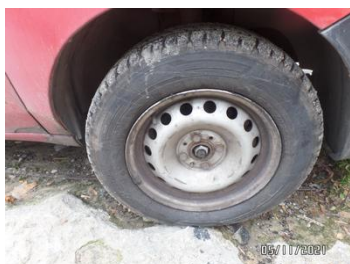
Fot. 10 foto 10