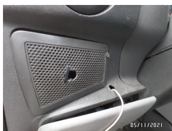
Fot. 39 foto 39