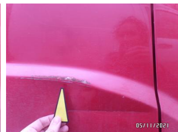
Fot. 28 foto 28