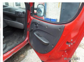
Fot. 44 foto 44