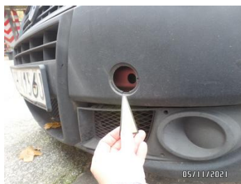
Fot. 11 foto 11