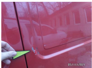
Fot. 25 foto 25