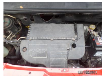
Fot. 56 foto 56