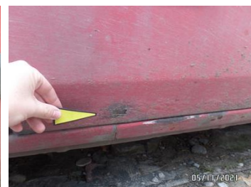
Fot. 32 foto 32