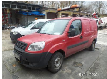
Fot. 1 foto 1

Rodzaj pojazdu: Samochód ciarowy do 3.5t