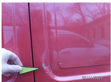
Fot. 29 foto 29