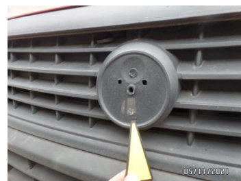
Fot. 12 foto 12