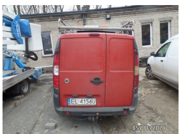
Fot. 5 foto 5