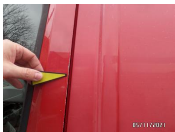
Fot. 15 foto 15