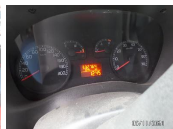
Fot. 36 foto 36