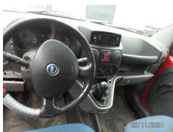
Fot. 43 foto 43