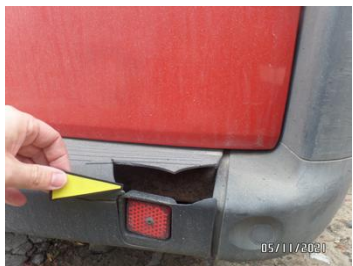
Fot. 21 foto 21