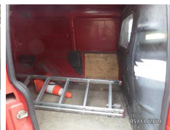
Fot. 48 foto 48