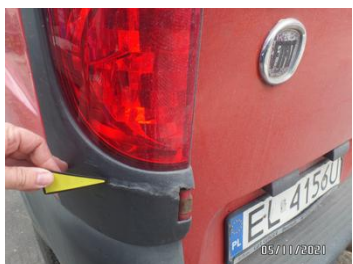
Fot. 17 foto 17