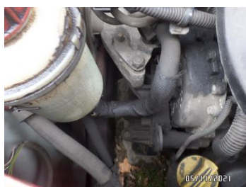
Fot. 59 foto 59