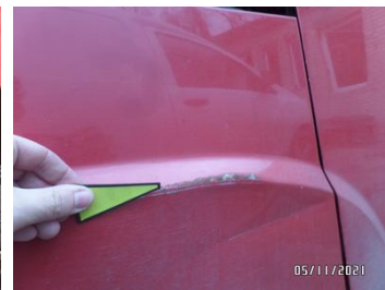
Fot. 24 foto 24