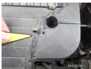
Fot. 58 foto 58