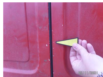
Fot. 20 foto 20