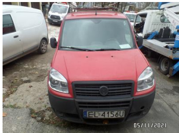
Fot. 2 foto 2