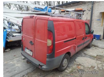
Fot. 4 foto 4