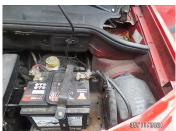
Fot. 57 foto 57