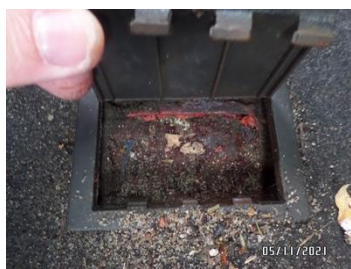
Fot. 46 foto 46