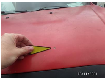
Fot. 13 foto 13