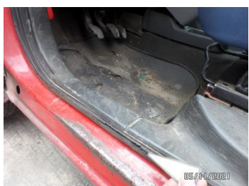
Fot. 41 foto 41