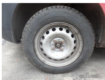
Fot. 7 foto 7