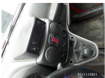
Fot. 37 foto 37