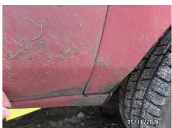
Fot. 33 foto 33