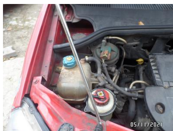
Fot. 55 foto 55