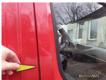
Fot. 30 foto 30