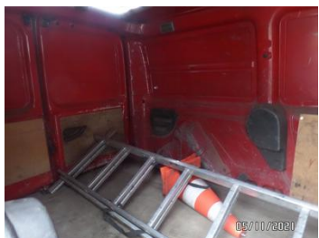
Fot. 49 foto 49