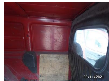
Fot. 52 foto 52