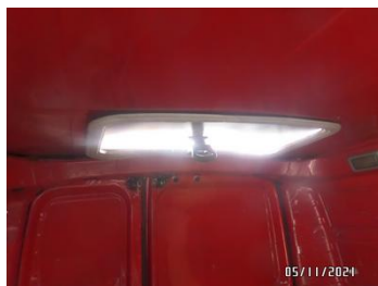
Fot. 51 foto 51