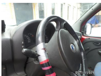
Fot. 38 foto 38