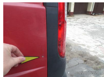
Fot. 16 foto 16