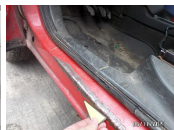
Fot. 40 foto 40