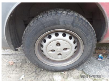
Fot. 9 foto 9