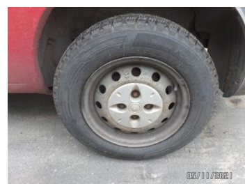
Fot. 8 foto 8