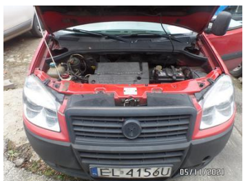
Fot. 53 foto 53