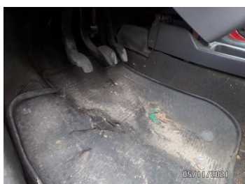
Fot. 42 foto 42