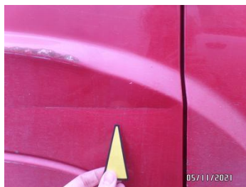
Fot. 27 foto 27