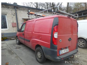
Fot. 6 foto 6