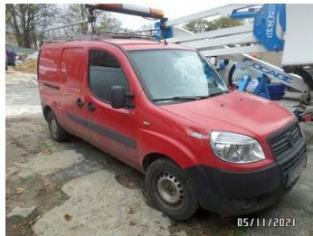
Fot. 3 foto 3