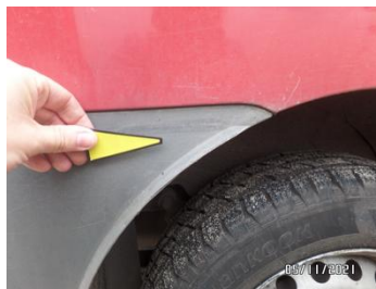
Fot. 23 foto 23