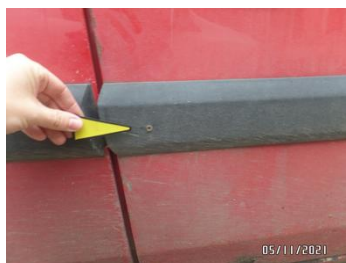
Fot. 31 foto 31