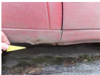
Fot. 26 foto 26