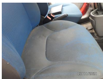
Fot. 47 foto 47