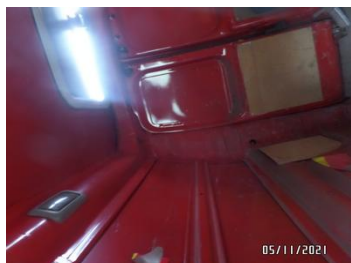
Fot. 50 foto 50