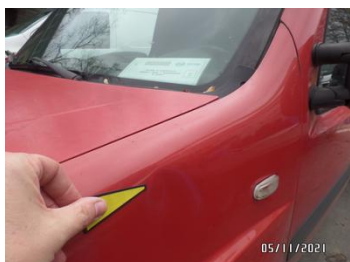
Fot. 14 foto 14