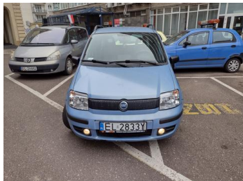
Fot. 2 foto klienta 2