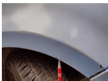
Fot. 15 foto klienta 15