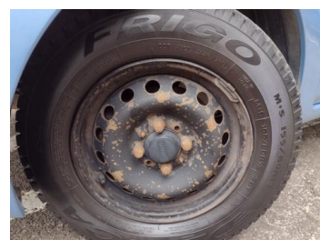
Fot. 8 foto klienta 8