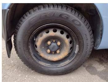
Fot. 7 foto klienta 7