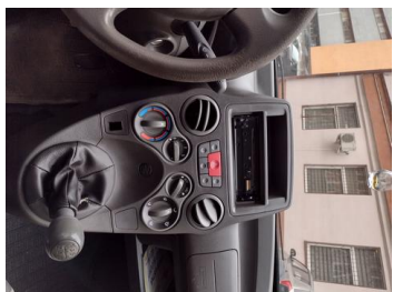
Fot. 25 foto klienta 25