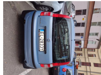
Fot. 4 foto klienta 4