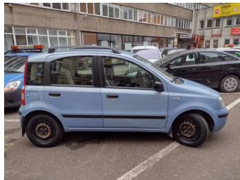
Fot. 3 foto klienta 3