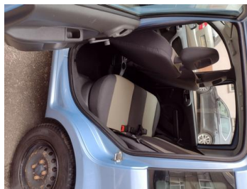
Fot. 23 foto klienta 23