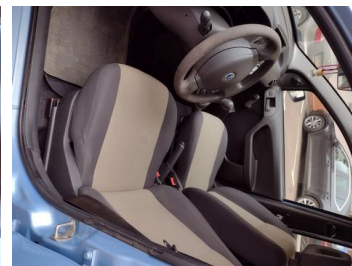
Fot. 24 foto klienta 24