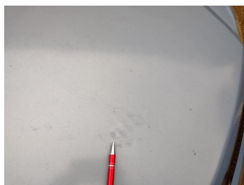
Fot. 11 foto klienta 11