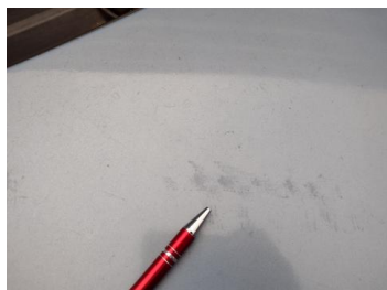
Fot. 26 foto klienta 26