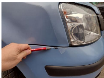
Fot. 10 foto klienta 10