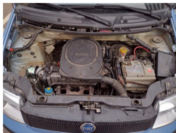
Fot. 22 foto klienta 22