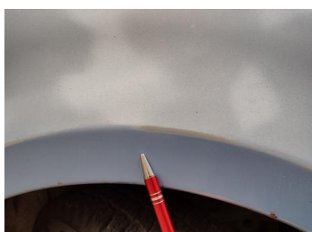
Fot. 14 foto klienta 14