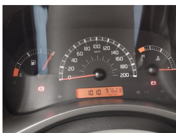
Fot. 6 foto klienta 6