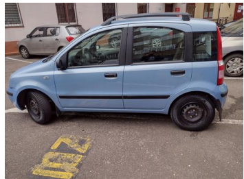
Fot. 1 foto klienta 1