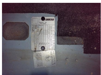
Fot. 5 foto klienta 5