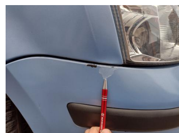
Fot. 16 foto klienta 16