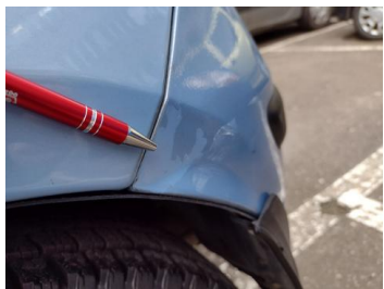
Fot. 21 foto klienta 21