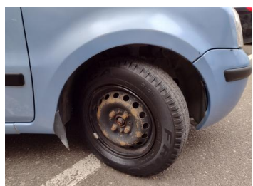
Fot. 13 foto klienta 13