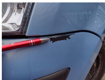
Fot. 19 foto klienta 19