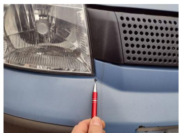
Fot. 17 foto klienta 17