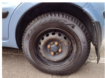
Fot. 9 foto klienta 9