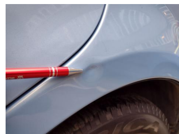
Fot. 20 foto klienta 20