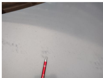
Fot. 27 foto klienta 27