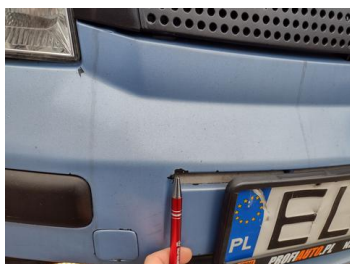
Fot. 18 foto klienta 18